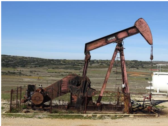
Campo petrolífero de Ayoluengo

El territorio englobado en el Proyecto Geoparque las Loras y el Complejo Paleontológico de Atapuerca y su entorno geológico y minero son ya de por sí lo suficientemente relevantes por sus respectivos