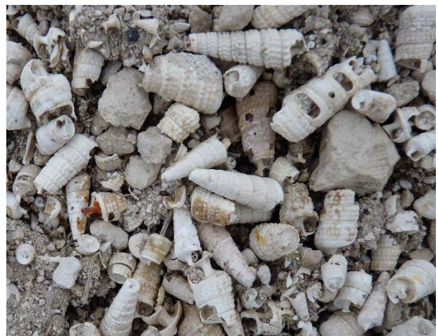
Fósiles del Mioceno de Castrillo del Val

Por la tarde, los asistentes a estas Jornadas podrán visitar el Museo de la Evolución Humana, en pleno centro de Burgos, finalizando tras esta visita unas Jornadas que tienen por objetivo dar a conocer dos de los muchos enclaves de interés natural y geológico de la provincia de Burgos.