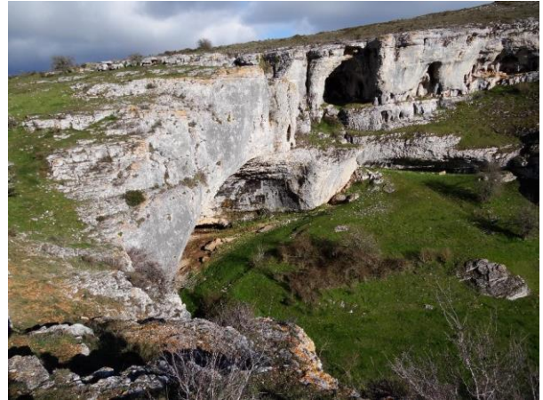
Valle ciego en Basconcillos del Tozo

La Comisión de Patrimonio Geológico (CPG) forma parte de la Sociedad Geológica de España (SGE), asociación científica con unos 1000 socios geólogos y profesionales de las Ciencias de la Tierra y de la divulgación de la naturaleza en aspectos relacionados con la gea. La Comisión representa a la SGE en la Unión Internacional para la Conservación de la Naturaleza (UICN) y en la Asociación Europea para la Conservación del Patrimonio Geológico (ProGEO), y participa activamente a nivel nacional e internacional en todos aquellos aspectos relacionados con la divulgación y conservación del patrimonio geológico, paleontológico y minero en todas aquellas áreas del conocimiento en las que la base geológica está presente.