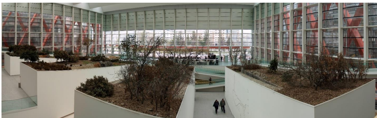
Acceso principal del Museo de la Evolución Humana

Durante estas XII Jornadas podremos analizar dos casos bien distintos en cuanto a su impacto mediático y relación con el territorio, aunque ambos tienen un trasfondo común en el que la geología, en sentido amplio, es la raíz de su interés.