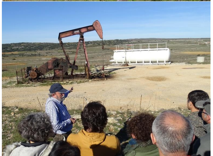
El campo petrolífero de Ayoluengo, en las Loras, es el único de la península