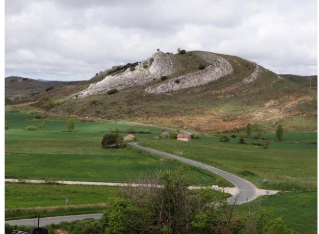
Pliegue en Rebolledo de la Torre

El sábado visitaremos algunos de estos lugares, cada uno con su propio aspecto de interés geológico y cultural —el Románico es muy importante en esta zona—, además de visitar el único campo petrolífero de la península y el Museo del Petróleo.