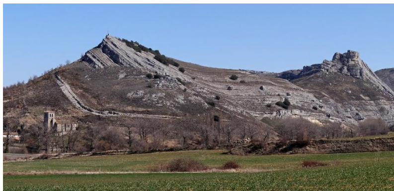
Castreñas y el castillo del Moro, sinclinal colgado con diversas fallas

Las Jornadas son aprovechadas por la Junta Directiva de la CPG-SGE para reunirse y en ella se trabaja sobre las acciones de la Comisión y en este caso sobre la organización de la XII Reunión Nacional de CPG-SGE , distinta a estas Jornadas, de periodicidad bianual y que se celebrará en 2017 en la isla de Menorca. Las anteriores Reuniones de este tipo se realizaron en 2015 en el Geoparque de la Costa Vasca , Zumaia; en 2013 en Segovia , en 2011 en León , etcetera.