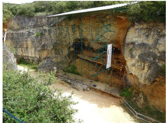
Yacimientos de Atapuerca

El Reglamento de Régimen Interno de la Comisión de Patrimonio Geológico de la Sociedad Geológica de España, establece reuniones periódicas de su Junta Directiva. Estas reuniones, además de tener un papel eminentemente funcional para tratar los temas relativos a los objetivos de la Comisión, sirven para promocionar e incentivar la conservación del patrimonio geológico — incluyendo el patrimonio geomorfológico y paleontológico— y el patrimonio minero del lugar donde se realizan, además de ofrecer a los socios de la Sociedad Geológica de España y al público en general, actividades paralelas basadas en el conocimiento y la gestión de dicho patrimonio. Las Jornadas anteriores se realizaron en Alpuente, Valencia, diciembre de 2005; Malpartida, Cáceres, diciembre de 2006; Manresa, Barcelona, diciembre de 2007; Jumilla, Murcia, junio de 2008, Girona, diciembre de 2008; Zaorejas, Guadalajara, octubre de 2009; Cincorres, Castellón, noviembre de 2011; Andorra, Teruel, noviembre de 2012; Cifuentes, Guadalajara, noviembre de 2013; Manresa, Bages, Barcelona, noviembre de 2014 y Coll de Nargó, Alt Urgell, Lleida, en noviembre de 2015.