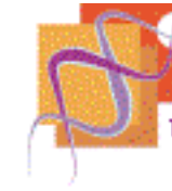
CSIC: DICIEMBRE 2005