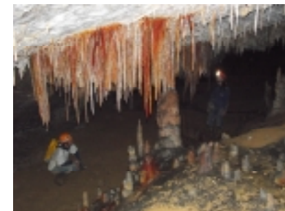
Espeleotemas de Arrikutz

A partir de las 16:00 de la tarde se visitara la cueva de Arrikutz y su centro de interpretación. Se accederá a la galería 53, desarrollada en calizas urgonianas del cretácico inferior. Está acondicionada para el turismo con una pasarela y luces dinámicas.