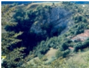
Sumidero de Gesaltza