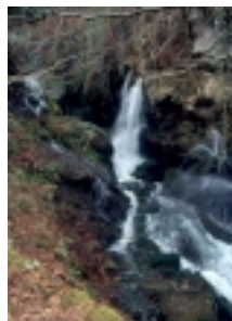
Surgencia de Iritegi

El itinerario discurre a través del karst de Arantzazu-Arrikutz con un recorrido de 3 km durante el cual seguiremos el curso del río Arantzazu. Veremos los puntos de encuentro con sus afluentes Bellotza y Sorginerreka. Se accederá a la cueva de Iritegi y a las surgencias del mismo nombre, así como al impresionante sumidero de Gesaltza, en cuyo interior veremos galerías fósiles y activas horadadas por el río Arantzazu.