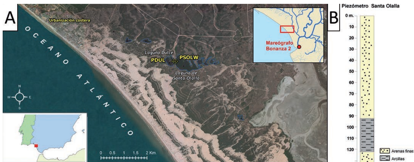
Fig. 1.- A) Ubicación de los piezómetros monitorizados en las proximidades de las lagunas Dulce y Santa Olalla, en un entorno de arenas estabilizadas y a tan solo 2,5 km del Océano Atlántico. En el margen superior derecho se muestra la localización del mareógrafo del cual se han obtenido los datos mareales. B) Columna litológica de un sondeo profundo ubicado en el entorno de Santa Olalla y que sirve de referencia para entender la litología de la zona (modificado de Salvany et al. , 2010)