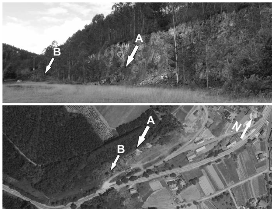
Fig. 2.- Aspectos de la sección estudiada al oeste de Rececende (Lugo), mostrando la posición relativa de la "capa Rececende" (B) con respecto al horizonte con graptolitos (A). Arriba, vista del escarpe de pizarra desde el este; abajo, imagen aérea (reproducida del SIGPAC), con las casas más occidentales de Rececende a la derecha.

Fig. 1.- Stratigraphical sketch from the Middle Ordovician-Silurian in the Mondoñedo Nappe, modified from Arbizu et al. (1997, fig. 49). Vertical black lines represent vertical range of the studied section west of Rececende village, \alpha according to previous works and \beta as proposed in this work (" Strophomena's beds " equals to "Rececende bed"). Significant levels from the Luarca slates ( sensu lato ) are numbered as follows: 1, " Strophomena's beds " in association with main sedimentary iron bed; 2, "Rececende bed"; 3, "Vilagondurfe bed". Lithology: a, quartzites and sandstones; b, glaciomarine diamictites; c, dark shales and slates; d, graptolitic black shales; e, marly shales; f, oolitic ironstone bed and associated coquinas (only known in the Rececende Syncline).