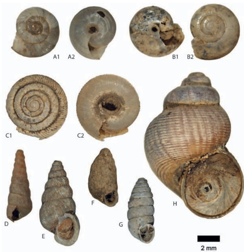
Fig. 3.- A) Xerosecta arigonis , vistas apical (A1) y umbilical (A2). B) Oxychilus sp., vistas umbilical (B1) y apical (B2). C) Discus rotundatus vistas apical (C1) y umbilical (C2). D) Clausilia bidentata , vista lateral. E) Obscurella obscurum , vista lateral. F) Granaria braunii , vista lateral. G) Chondrina avenacea , vista lateral. H) Pomatias elegans , vista lateral. Fig. 3.- A) Xerosecta arigonis , apical (A1) and umbilical (A2) view. B) Oxychilus sp., umbilical (B1) and apical (B2) view. C) Discus rotundatus , apical (C1) and umbilical (C2) view. D) Clausilia bidentata , lateral view. E) Obscurella obscurum , lateral view. F) Granaria braunii , lateral view. G) Chondrina avenacea , lateral view. H) Pomatias elegans , lateral view.