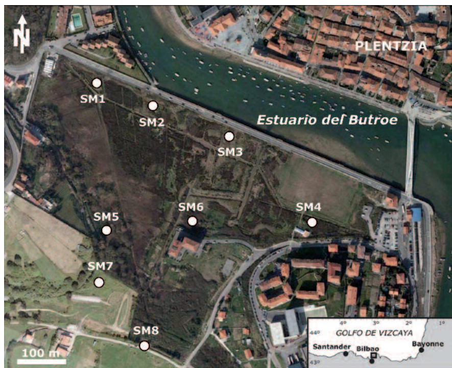
Fig. 1.- Localización de los sondeos perforados en la marisma de Txipio (Estuario del Butroe).

Dentro del estudio "Plan Especial Marina de Txipios (Diputación Foral de Bizkaia)", en el año 1989 se perforaron por rotación 8 sondeos obteniendo testigos continuos de aproximadamente 10 cm de