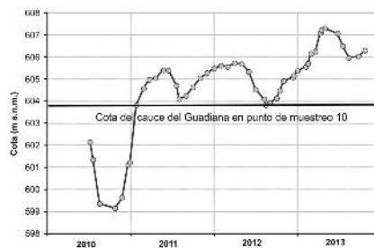
Fig. 2.- Evolución de la cota del agua subterránea entre 2010 y 2013 en el punto de muestreo 2.

En todo este período, la circulación de agua por el Guadiana hacia Las Tablas de Daimiel ha sido vista como un criterio de recuperación del sistema acuífero regional, y la opinión pública local ha realizado un seguimiento, casi a tiempo real, utilizando todos los procedimientos de información actuales. A partir de esta información, se puede seguir la aparición de salidas de agua de posible origen subterráneo en algunos tramos del Guadiana y la llegada del Azuer a Las Tablas por primera vez en 30 años, en otoño de 2011 e invierno de 2012,