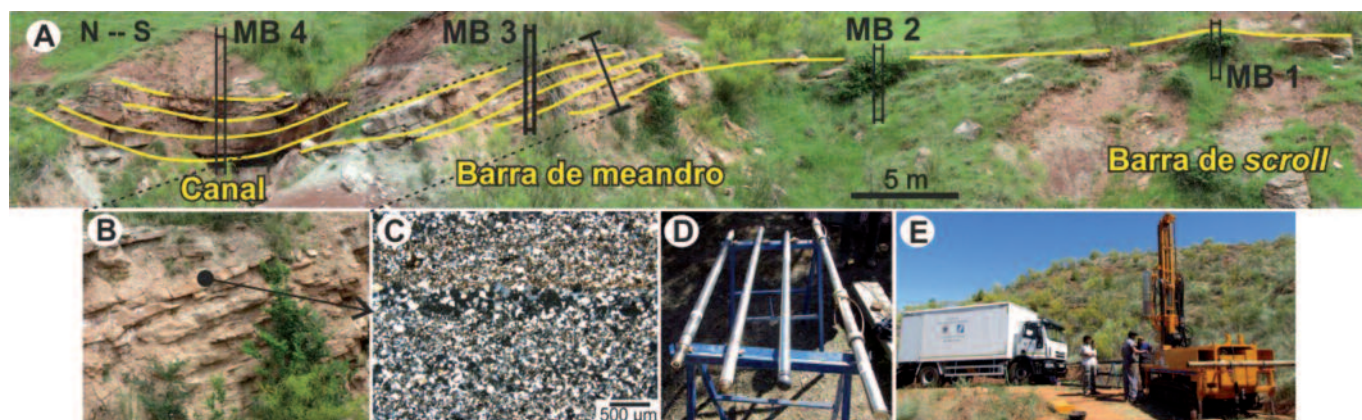
Fig. 2.- A) Fotointerpretación de las facies del canal meandriforme, incluyendo la posición de los 4 pozos realizados. El pozo MB 3 sobre la barra de meandro es el objeto de estudio. B) Mesoscale detail of the point bar sedimentary architecture. C) Microscale detail of one of the sandstone layers making up the point bar. D) Downhole logging used equipment. E) Drilling used equipment.

El afloramiento ha sido escogido en base a la excelente preservación del cuerpo de arenisca, al grado de exposición y a la accesibilidad. Así, tras el muestreo dirigido al análisis petrológico y petrofísico de de-