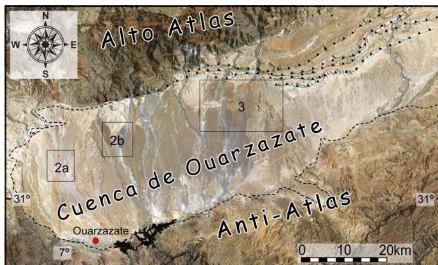
Fig. 1.- Imagen Landsat de la cuenca de Ouarzazate. Las cajas indican la localización de las capturas fluviales (figuras 2A, 2B y 3).

Fig. 1.- Landsat image of the Ouarzazate basin. The boxes indicate the location of the captures (figures 2A, 2B and 3).