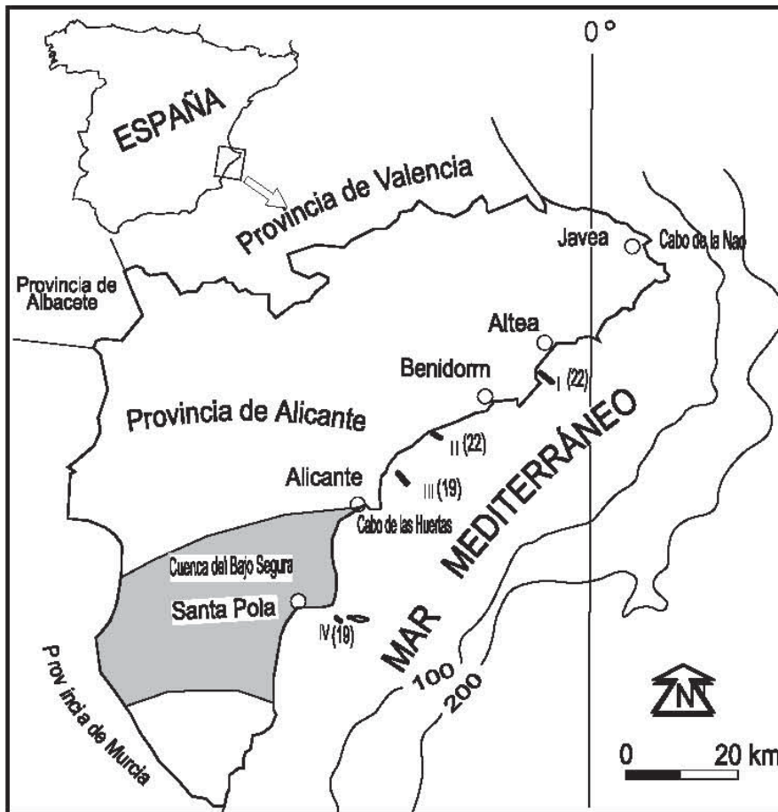
Fig. 1.- Mapa de la provincia de Alicante con las isobatas de 100 y 200 metros. Los números indican la posición de los perfiles sísmicos y entre paréntesis la profundidad del techo del prisma litoral.

Fig. 1.- Alicante Province map with the 100 and 200 m deep contour lines. The numbers indicate the location of the seismic lines and in brackets the depth of the coastal prism top.