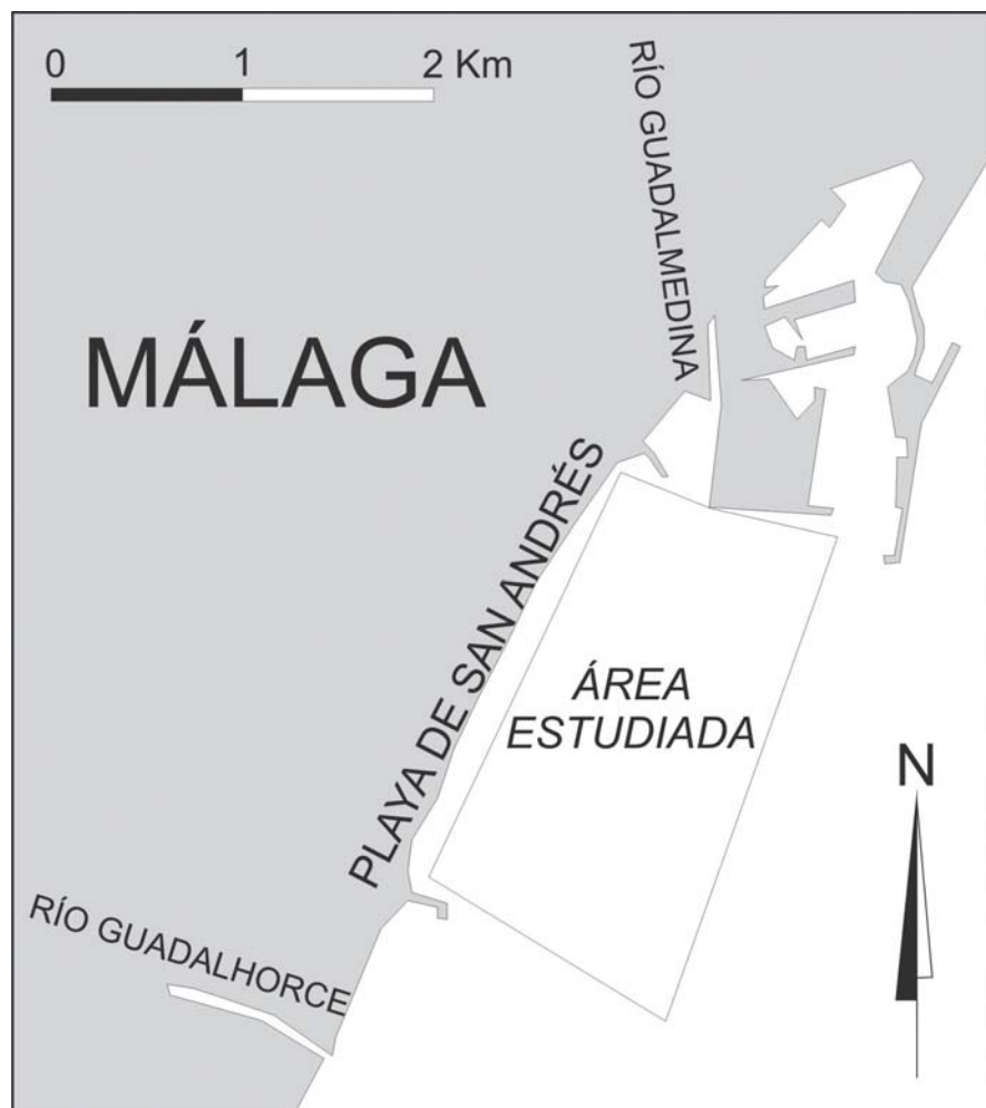
Fig.1.- Localización del área de estudio en el marco de la Bahía de Málaga