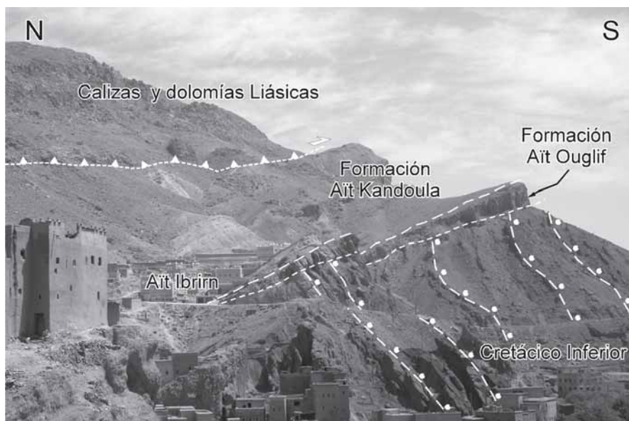
Fig. 4.- Discordancia de la formación Aït Ouglif sobre las areniscas del Cretácico inferior. Al norte se observa un cabalgamiento fuera de secuencia que hace emerger el Liásico del manto de Toundout, superponiéndolo a las formaciones Aït Ouglif y Aït Kandoula.