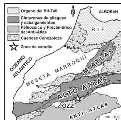
Fig. 1.- Esquema tectónico del norte de África mostrando la localización del área de estudio. OZZ = Cuenca de Ouarzazate.

La sucesión estratigráfica de la zona de estudio, respecto a su relación con la deformación principal Cenozoica, puede ser divididos en dos grupos: materiales pretectónicos y materiales sintectónicos, aunque hay una formación que puede si-