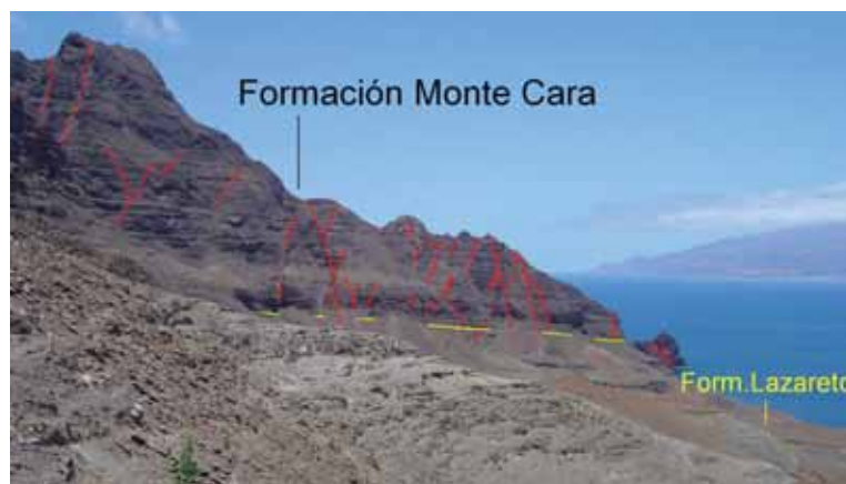
Foto 1.- Principales unidades del Edificio Antiguo, en el sector oeste de la isla. Vista de la parte externa; al fondo la isla de Santo Antao. La línea amarilla marca la separación entre la formación Lazareto y la formación Monte Cara. En rojo se han marcado los principales diques.

Edad del edificio. Se han datado con el método K/Ar siete rocas de estas unidades (Tabla I). Las coladas de la formación Lazareto están tan alteradas y llenas de vesículas que no ha sido posible encontrar muestras adecuadas para