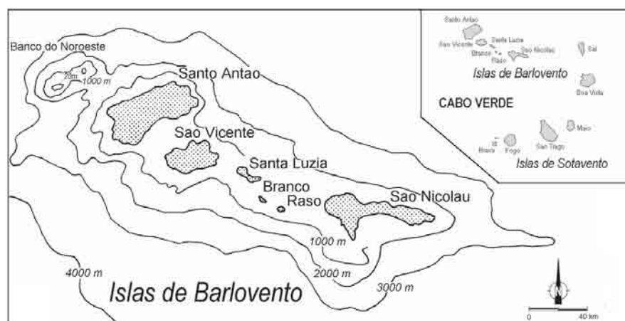
Fig. 1.- Distribución y batimetría de las islas de Barlovento y su situación dentro del archipiélago de Cabo Verde

En la zona interior, cubiertas parcialmente por depósitos sedimentarios recientes, afloran rocas intrusivas (gabros, sienitas, ijolitas,...), extrusivas (fonolitas, nefelinitas...) y volcánicas submarinas,