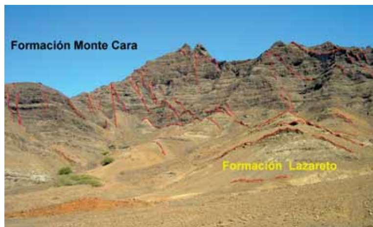
Foto 2.- Principales unidades del Edificio Antiguo, en el sector oeste de la isla. Vista de la parte interna. En rojo se han marcado los principales diques.

Photo 1.- Main units of the Old Edifice in the western sector of the island. View of the outer side: Santo Antao on the background. The yellow line marks the boundary between the Lazareto Formation and the Monte Cara Formation. The most conspicuous dikes are marked in red colour.