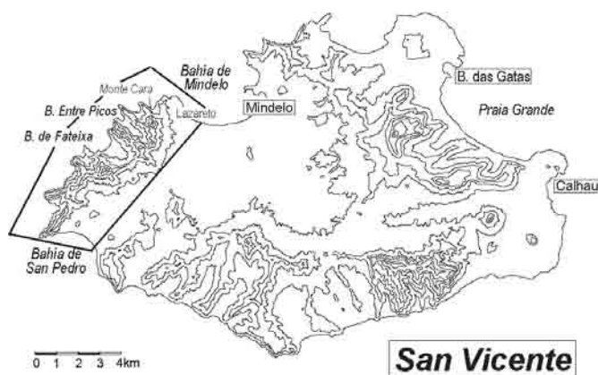
Fig. 2.- Mapa topográfico esquemático de la isla de San Vicente. Equidistancia de las curvas de nivel 100 m. El área enmarcada corresponde al sector objeto de estudio.