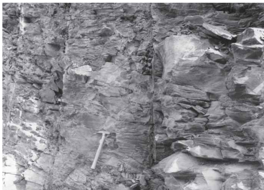
Foto 1.- Aspecto parcial del aflojamiento pizarroso.

Las medidas realizadas en los afloramientos de la berma superior han sido según una línea transversal que corta distintos términos pizarrosos y areníticos, donde el grupo dominante de las discontinuidades determinadas presenta una orientación NNO-SSE. Los máximos valores de las familias 1 y 2 establecidas en ese afloramiento forman un sistema con un ángulo 2s entre ellos de 17° subhorizontales o buzando ligeramente al oeste. Asimismo, se define una familia subvertical de dirección NO-SE, y otras NNO-SSE con buzamientos intermedios (40-54°) hacia el sur. El espaciado de las discontinuidades varía de muy cerrado a cerrado, y la abertura de muy sellada, en la mayoría de los casos, a extremadamente ancha en las superficies de estratificación, en las litologías predominantemente areniscosas. La rugosidad es muy variable y oscila entre 0-2 en superficies de foliación y 10-12 en superficies de estratificación donde se observa la existen-