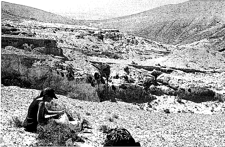
Fig. 2.- Vista general del depósito eólico de Barranco de los Encantados, norte de Fuerteventura.