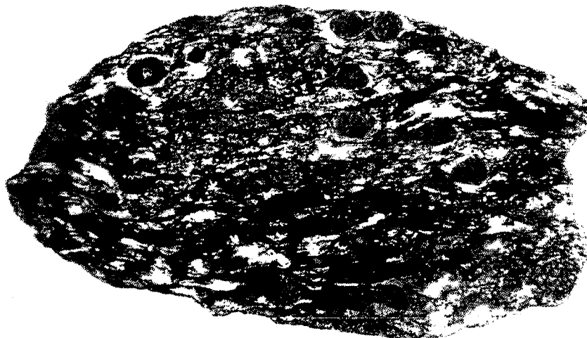
Fig. 2.- Aspecto general de un enclave (en sección) mostrando la distribución de los granates y sus relaciones con la foliación metamórfica.