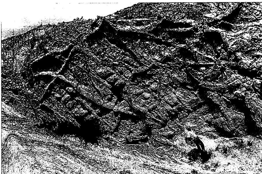
Fig. 3.- Vista general del yacimiento de Megaplanolites ibericus .