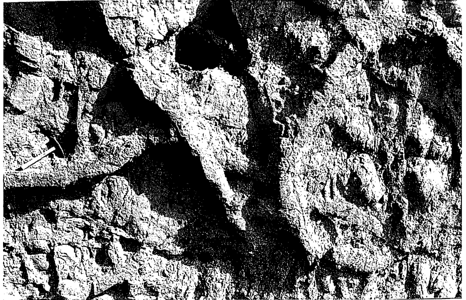
Fig. 4.- Detalle del afloramiento de las icnitas de Bueña (Teruel).

Fig. 4.- Detail of outcrop of de trace fossils from Bueña (Teruel).