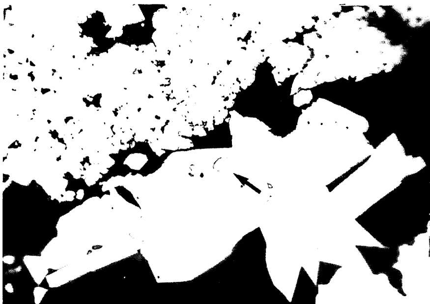
Fig 1.-Fotomicrografía con luz reflejada: Grano de oro redondeado de 9 \mu m incluido en cristal de pirita. N//.

Fig 1.-Reflected-light photomicrograph: Pyrite with a rounded inclusion of gold of 9 \mu m.