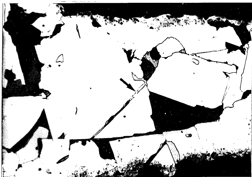
Fig 3.-Fotomicrografía con luz reflejada: Venilla de 3 \mu\text{m} de espesor con amalgama de Au-Ag-Hg en pirita. Esfalerita (gris oscuro) con calcopirita. N.//.