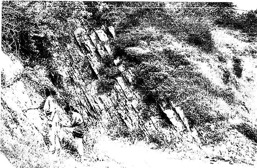
Fig. 3.— Aspecto de las calizas del Bajociense (Biozonas Subfurcatum-Garantiana) en los alrededores de Lekunberri: facies micríticas con ammonoideos y escasos restos de esponjas.