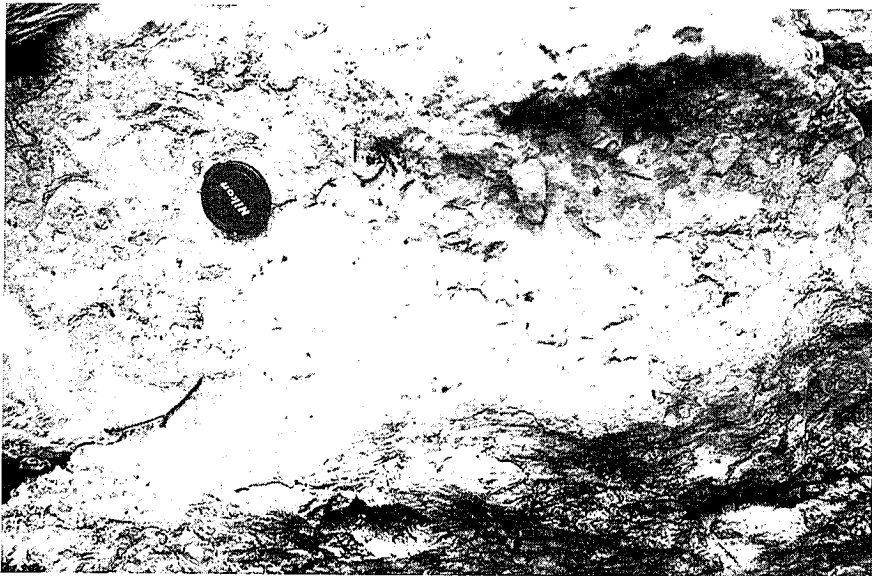
Fig. 2.— Aspecto de campo de las calizas de esponjas en Izarriteko, en facies bioconstruidas.