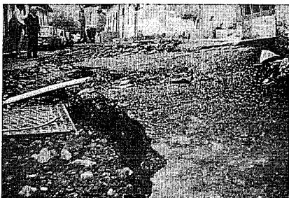
Fig. 1.—Grieta entre Los Cuarteles vista desde el lado de la huerta (situación el 31 de mayo).

Boó se encuentra a unos 3 km del pueblo de Moreda, en el Concejo de Aller, perteneciente al Principado de Asturias, en plena Cuenca Carbonífera Central. La litología de los alrededores del área a tratar es una alternancia de areniscas, areniscas pizarrosas y pizarras, con intercalaciones de capas de carbón de diversos