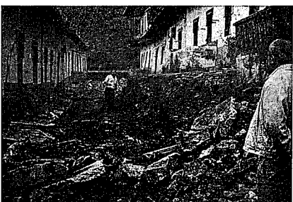
Fig. 2.—Idem foto anterior (situación el 9 de julio). El mayor desplazamiento medido fue de 160 cm.