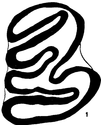
Fig. 1.— Castor fiber . P4 inferior derecho. Nivel TD-5/6.

Familia: CASTORIDAE GRAY, 1821. Género: Castor LINNEO, 1758. Castor fiber LINNEO, 1758 (figs.1-3).