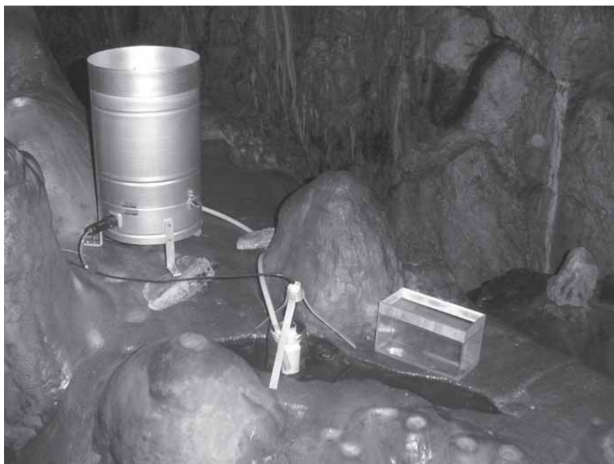
Fig. 1.- Control del goteo de estalactitas en la Cueva del Agua (Iznalloz, Granada).