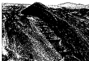
Fig. 2.—Imagen de los afloramientos del arrecife Bía, tomada longitudinalmente, desde el Oeste hacia el Este.

El núcleo de la bioconstrucción constituye la parte volumétricamente más importante del edificio. Forma un cuerpo de 90 metros de longitud y 9 de altura. Este cuerpo presenta estratificación planar, inicialmente subhorizontal, con estratos que disminuyen de espesor desde la base hasta el techo. Los